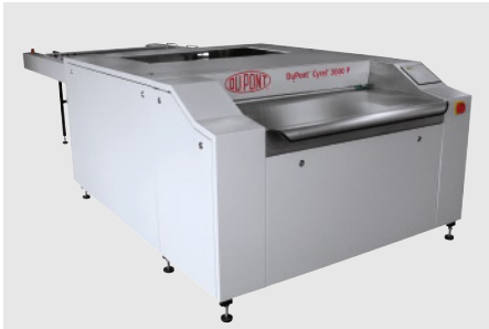
DuPont™ Cyrel® 3000 P